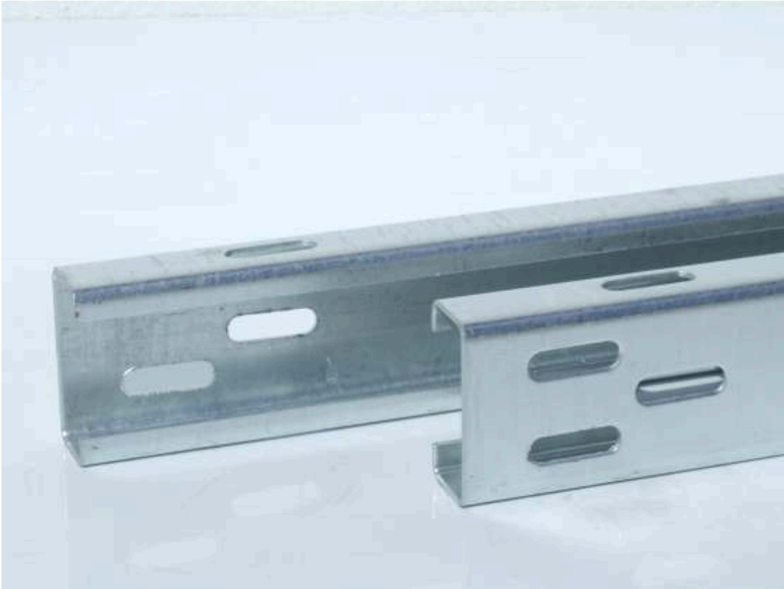
POSTE TIPO "C"