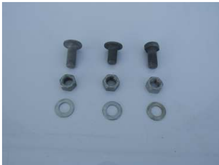
JUEGOS DE TORNILLOS