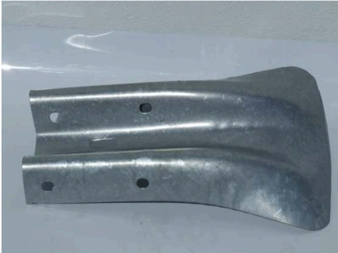
COLA DE PEZ